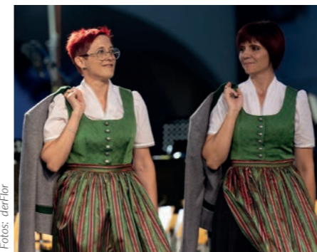
▲ Marktenderinnen im neuen Dirndl