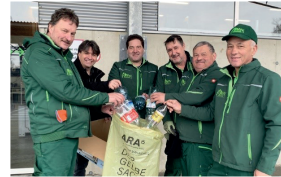
▲ Die Mitarbeiter im Ressourcenpark in Ratschendorf beraten Sie gerne.

Verpackungen im Ressourcenpark in Ratschendorf abgeben: Auch im Ressourcenpark Ratschendorf