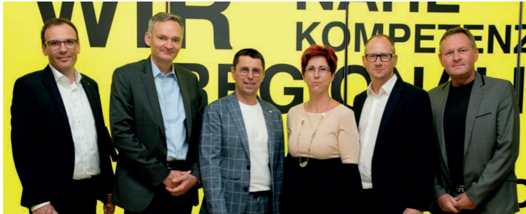
▲ Geschäftsleitung, Spitzenfunktionär:innen, Vertreter vom Raiffeisenverband und RLB-Steiermark