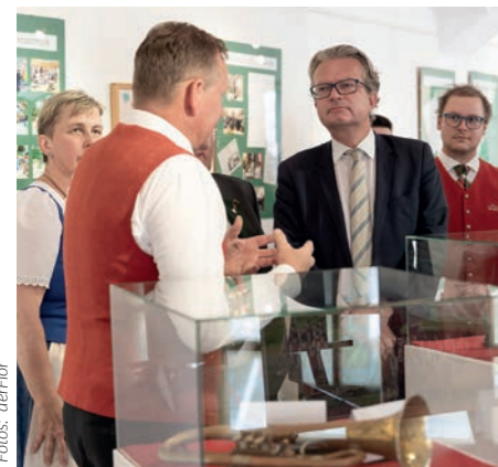
▲ Besuch der Ausstellung zum Jubiläum