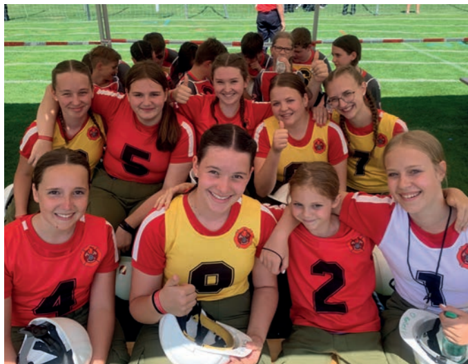
▲ Die siegreichen Mädchen der Freiwilligen Feuerwehr Dirnbach beim Landesbewerb der Feuerwehrjugend Steiermark in Voitsberg