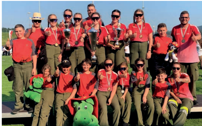
▲ Die Mannschaften der FF Dirnbach mit ihren BetreuerInnen