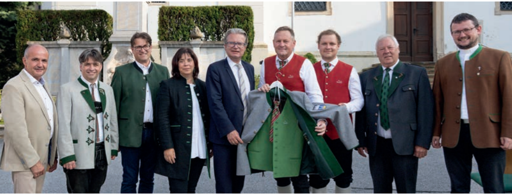
▲ Übergabe der neuen Tracht durch Landeshauptmann Christopher Drexler