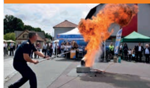
Rüsthausegnung und Sicherheitstag