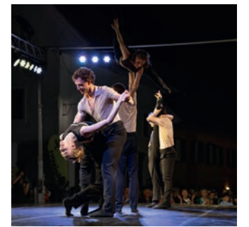
▲ Die Tänzerinnen und Tänzer der Oper Graz tanzten zum Ballett "Romeo und Julia" von Sergei Prokofjew, vorgetragen von der MMK Straden