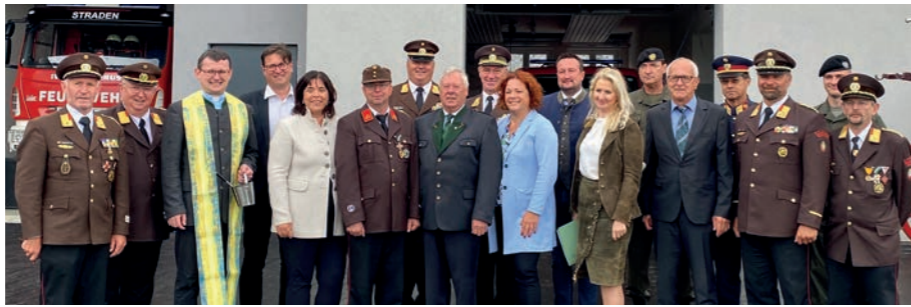
▲ Zahlreiche Ehrengäste kamen zur Segnung des neuen Rüsthauses der FF Straden