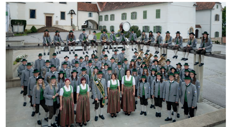
▲ Gruppenfoto der Marktmusikkapelle Straden in der neuen Tracht