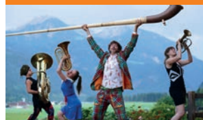
grad&schräg O23 Festival in vier Viertel