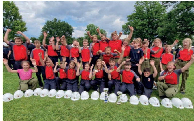
▲ Beeindruckender Teamgeist beim Feuerwehrnachwuchs