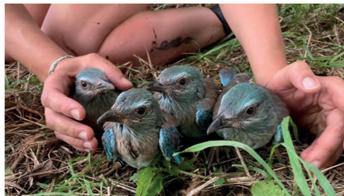
▲ Vier junge Blauracken wurden bereits beringt

Mahd auf fetten Wiesen und die Gräser dominieren die Wiese, sprich, sie verdrängen viele lichtliebende Kräuter. Man muss also den Stickstoff aus dem Boden holen, durch Mahd und Abtransport des Mähgutes. Wenn die Wiese mager wird, haben viele Pflanzen- und Tierarten durch eine spätere Mahd eine Chance. Das schmeckt auch den Kühen und anderen Pflanzenfressern, die sonst nur Silofutter fressen und nun zusätzlich unser Heu bekommen. Kräuter soll man sammeln, solange sie noch nicht blühen. Ab der Blüte werden Bitterstoffe eingelagert, um die Samen zu schützen. Erst bei der Samenreife werden diese wieder genießbar oder süß. Dann dient der Genuss der Früchte auch der Verbreitung der Samen. Die Teilnehmer konnten einiges über die heimischen Kräuter lernen.