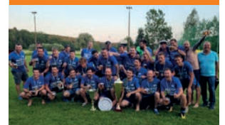
Meister im Oststeirercup Aller guten Dinge sind drei