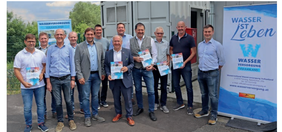
▲ Die Verantwortlichen des Wasserverbandes mit den Bürgermeistern

Fünf bis sieben Tage Versorgungssicherheit seien im Blackoutfall durch die Notstromaggregate und 20.000 Liter eingelagerten Diesel gewährleistet, so