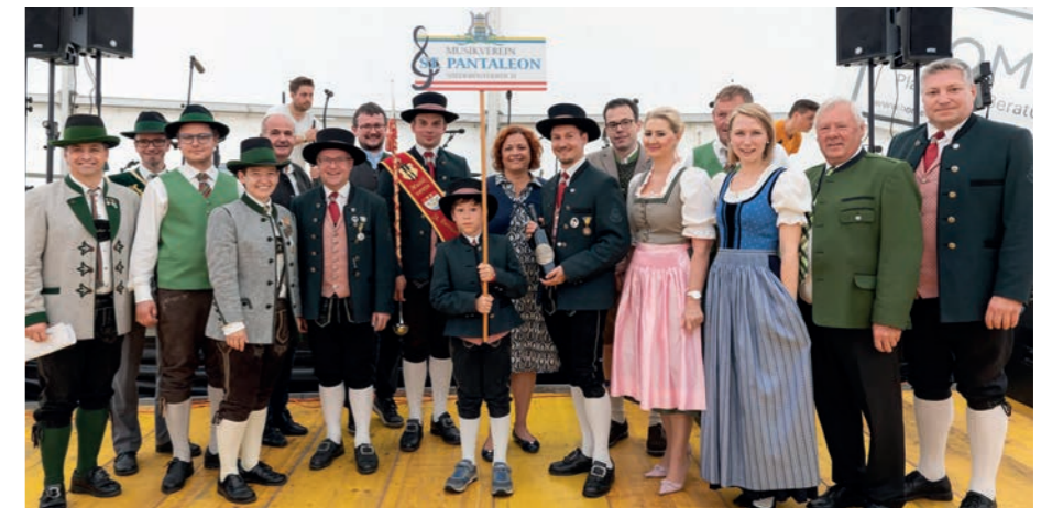
▲ Der Musikverein St. Pantaleon aus Niederösterreich besuchte uns in Straden

Das dreitägige Jubiläumsfest erwies sich als großer Erfolg und trug dazu bei, den Zusammenhalt in Straden sowie in der Musikkapelle weiter zu stärken. Die Marktmusikkapelle Straden bedankt sich herzlich bei allen Gästen, Sponsoren und freiwilligen Helfern, die zum Gelingen des Festes beigetragen haben.