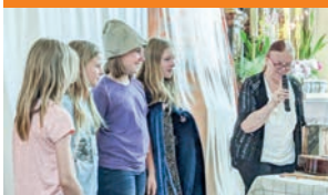
Jugendtheater bei der Langen Nacht der Kirchen